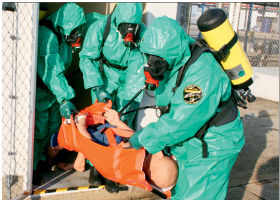
Mit Übungsdummys wurden Verletzte dargestellt