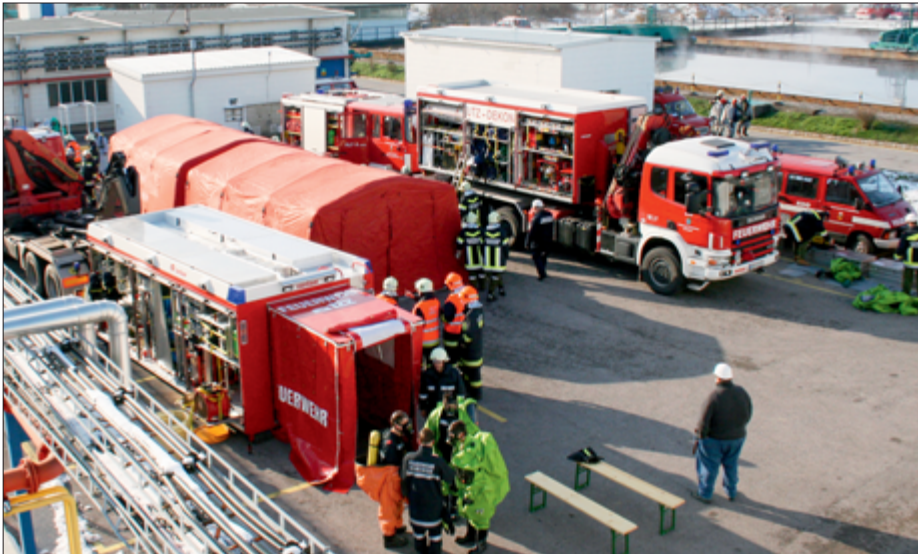
Im Übungseinsatz standen Schadstoffdienste aus vier Bezirken