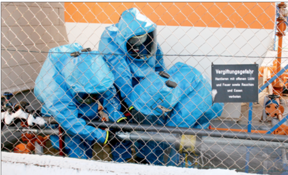
Sechs Drei-Mann-Trupps arbeiteten an den lecken Leitungen