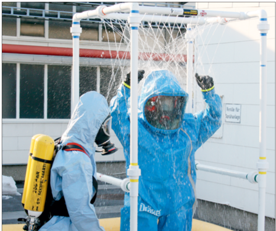
Selbstschutz wird groß geschrieben: Schutzanzugträger bei der Dekontamination

Zusammenarbeit mit Spezialfirmen wie OMV und Baxter und mit den im Schadstoffzug integrierten Spezialisten für Strahlenschutz und Wasserdienst